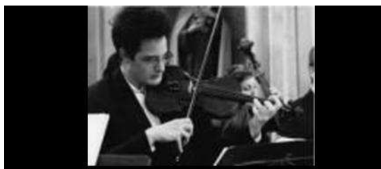
Violoniste pour une cérémonie de mariage