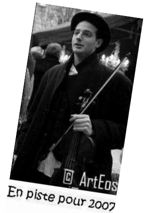
Scène ouverte, festival Jonglissomo

Le spectacle vivant, l'action culturelle, a toujours été pour moi, un moyen d'épanouissement personnel, un outil de partage.